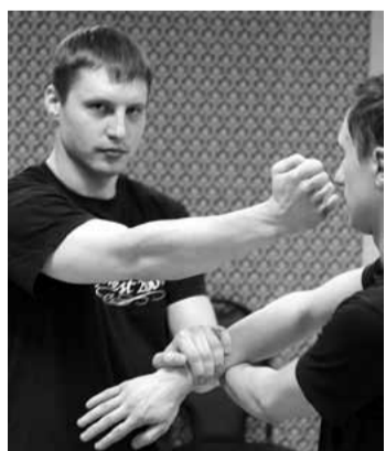
(2010) и Рождение легенды (2010), ставших популярными и в России. Кемеровская школа Вин Чун линии Ип Ман, на протяжении двух лет работает на базе фитнес-клуба «Хармика», расположенного в самом центре города.

Согласно легендам стиль Вин Чун возник в Китае около 300 лет назад. Изначально стиль отличался от других китайских боевых искусств, так как в Вин Чун отсутствовали красивые, но малоэффективные в бою движения (размашистые атаки, высокие удары ногами, прыжки). В целом приоритетом была отточенная техника, а не жесткость и физическая сила. В XIX веке Мастер Ип Ман, развивавший Вин Чун в Гонконге, значительно усовершенствовал прикладной аспект техники. Это вполне закономерно, поскольку Гонконг — крупный мегаполис, существующий в стыке культур Востока и Запада, впитавший в себя как восточные традиции, так и западные прагматичные и утилитарные ценности. Первая волна интереса к Вин Чун появилась благодаря Брюсу Ли, который до своего отъезда в США также тренировался под руководством Ип Мана. В результате, Вин Чун вышел за пределы Китая и развился до уровня мирового бранда. Сегодня большое количество людей во всем мире интересуется Вин Чун, а про Мастера Ип Мана было снято 3 фильма Ип Ман (2009), Ип Ман 2