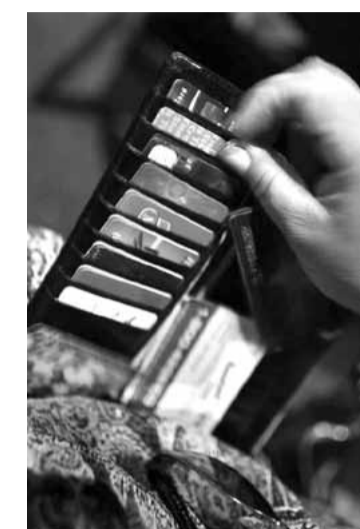
Окончание на стр. 8

недавно в Кемерове был вынесен приговор предпринимателю из Новосибирска, которому было предъявлено обвинение в хищении более 500 тыс. рублей из банкоматов в Кемерове. Согласно материалам уголовного дела, в начале ноября 2008 года группа хакеров через Интернет получила доступ к электронным ресурсам платёжной системы RBS WorldPay: была скопирована информация о счетах клиентов, включая PIN-коды. При этом злоумышленники увеличили балансы и лимит снятия денежных средств с каждой карточки. В течение около двух дней — 7 и 8 ноября 2008 года через банкоматы Испании, Японии, Китая, Турции, Великобритании, США, Голландии, Новой Зеландии, Филиппин, Украины и России (в Санкт-Петербурге,